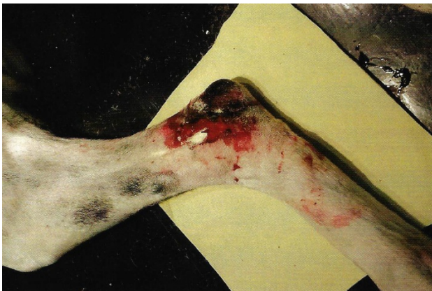
(Poranění zadního běhu kousnutím)

První pomoc: Rána musí být vždy vyčištěna, přičemž začínáme na kůži a okrajích rány, teprve pak se čistí a dezinfikuje vnitřek hluboké rány. Nakonec ránu překryjeme sterilním obvazem a podle rozsahu a vážnosti poranění navštívíme veterináře.