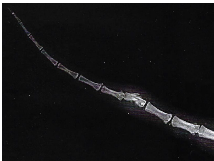
(Rentgenové snímky- nahoře těla psa zasaženého broky, dole psa se zlomeninou prutu)