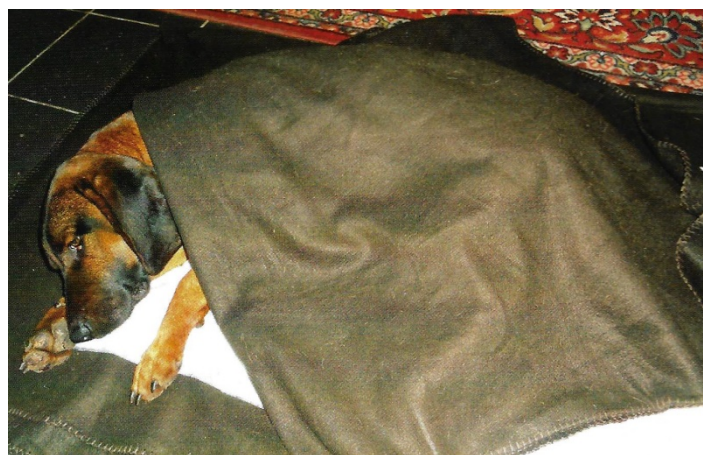
(Po náročném veterinárním zákroku by měl být pes v klidu a teple)