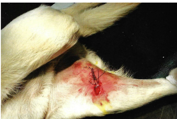
(Zadní běh psa ošetřeného po autonehodě)