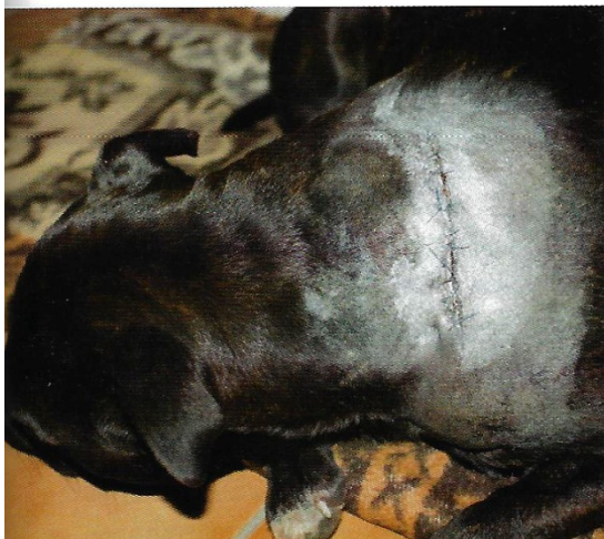
(Tržná rána na krku s "kapsou" před ošetřením na veterinární klinice a po něm)