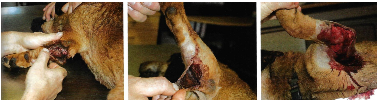
(Silně znečištěnou ránu na předním běhu bylo potřeba nejprve zbavit nečistot)

Rány způsobené kousnutím mají častí větší rozsah, než se zdá na povrchu. Vznikají pokousáním od psů nebo při kontaktu psa se zvířeti (liška, jezevec, divočák). Proto je nutné přesvědčit se o ochranné vakcinaci psa proti vzteklině. Psím pokousáním vznikají typické zhmožděniny. Kůže může vypadat relativně neporušená, protože je pružná. Kousnutí do končetin je značně bolestivé; pes kulhá, krvácí a může vzniknout otok. Pokousání v oblasti hrudníku a břicha je nutné vždy považovat za perforované zranění, rány na hrudníku mohou vést k pneumotoraxu (viz výše).